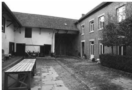
Binnenplaats (pleij) van Klein Geusselt.

Tussen de regels door schetst zij hoe het boerenbedrijf zich in de praktijk manifesteerde. Haar verhaal biedt een waardevol inkijkje in de geschiedenis van Hoeve Klein Geusselt en de familie Van Eijs , die er meerdere generaties woonde.